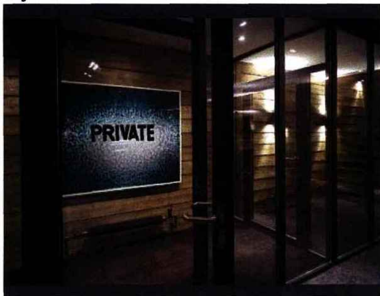
Reto Guntli ©

"Ce chalet des années 1960, réhabilité dans le respect de son architecture, fait désormais la part belle aux espaces contemporains, à l'élégance des matériaux et aux détails précieux "